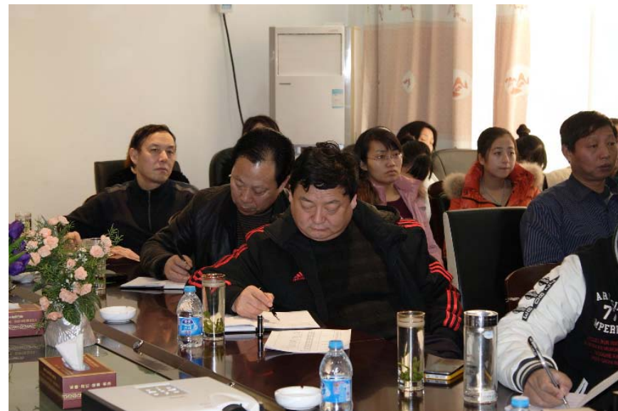
(集团公司总经理班子、各经营单位班子成员、集团本部人员认真参加培训)

全神贯注的倾听,激烈碰撞的辩论,专心致志的思考,时不时爆起热烈的掌声。三天来,集团公司组织的员工培训,成为岁末年初的一道饕餮盛宴,让所有员工受益匪浅。