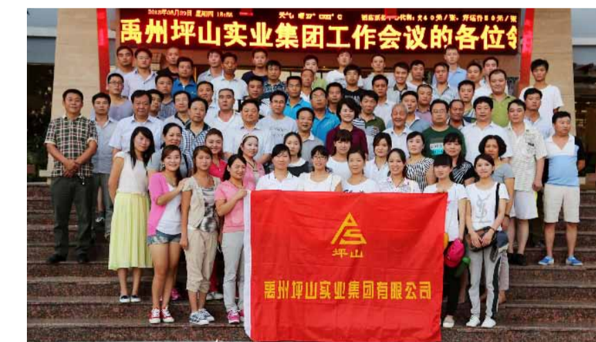
(全体与会人员在鲁山下汤镇皇姑浴酒店门前合影留念)