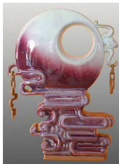
坪山钧窑钧瓷作品 彩云追月

“陶瓷文化和孝道文化一样,是中国传统文化的重要组成部分。一个是传统文化的载体,一个是传统文化的核心。”日前,在郑州中原福塔隆重举行的“2013寻找中原十大孝子”大型公益活动暨“孝文化论坛”启动仪式上,与会嘉宾和各届代表在对中国“孝文化”畅所欲言的同时,也对坪山钧窑钧瓷产品所表现出来的文化内涵赞赏不已。